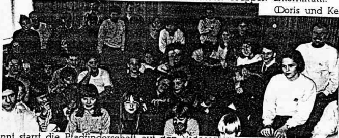
Gebannt starrt die Pfadfinderschaft auf den Videoschirm.